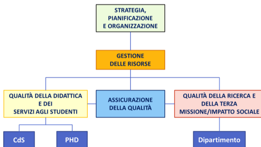
Figura. 1 – La struttura del modello di AVA3

La struttura del modello AVA3 di ANVUR approvato con Delibera del Consiglio Direttivo ANVUR n. 183 dell'8 settembre 2022 è schematizzata in Figura 1.